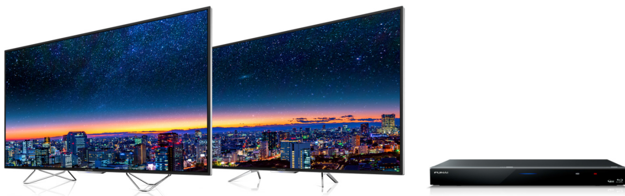
FUNAI 4K 対応テレビ FL-65UA6000 (左) / FL-65UD4100(中) / FUNAI ブルーレイディスクレコーダー FBR-HX3000 (右)

船井電機は、2017年6月にヤマダ電機グループで独占販売を開始したFUNAI 4K 対応テレビの6000シリーズおよび4100シリーズに、それぞれ65V型を追加、またFUNAI ブルーレイディスクレコーダーに2機種を追加し、11月3日より発売致します。