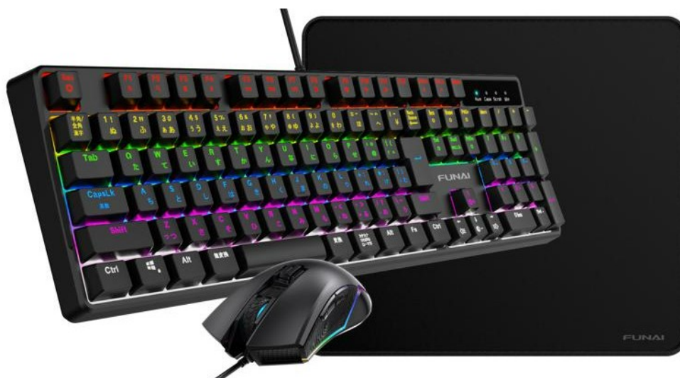
FUNAI ゲーミングスターターキット「FSK-3G350」