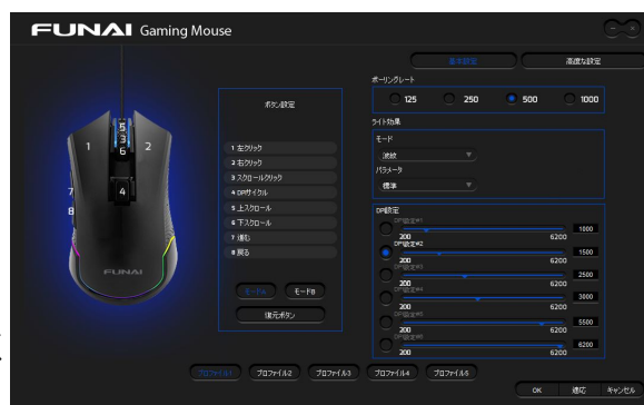
FUNAIゲーミングマウスソフトウェア設定画面

専用ソフトを使用して、よく使うコマンドなどを、6個のボタン+ホイールの上・下回転の合計8個それぞれに設定が可能。また、マクロキーも使うことができ、ゲーム内のアクションを指先一つで発動できます。プロフィールを保存して、ゲームにあった自分のプレイ環境の切り替えが素早く行えます。