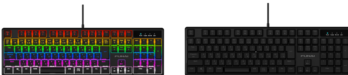
メカニカルゲーミングキーボード(左：発光時、右：非発光時)