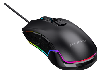
ゲーミングマウス

約1,680万色に光るRGBバックライトを自分の好みの光り方に設定することができ、ゲームの雰囲気を高めます。また、DPI設定切り替え時にはホイール部分の色が変わり、どの設定になっているのかを一目で判断することができます。